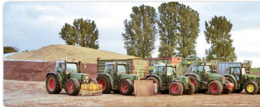
Einbringung der Maiseserte im Projekt Bergheim, Oktober 2007

Mit dem Solarfonds Niedersachsen I bietet die Windwärts Energie GmbH seit Mitte Oktober eine Fondsbeteiligung an acht Photovoltaikanlagen mit einer Gesamtleistung von 670 Kilowatt peak an. Die bereits in Betrieb genommenen Anlagen befinden sich auf Dächern von privaten und öffentlichen Gebäuden