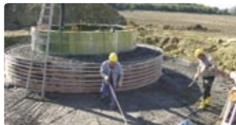
Projekt Wüllersleben/Erfurt: Errichtung von sieben E-48 Weiterentwicklung von Biogasprojekten wurden Kontakte zu weiteren Projektplanern aufgebaut.

Die Windwärts Energie GmbH war bei Informationsveranstaltungen zum Windwärts Genussrecht 2006 und den Messen „Grünes Geld“ in Düsseldorf und „PrivatInvest“ in Hannover sowie auf mehreren Windfesten präsent. Viele Interessierte nutzten die Gelegenheit um persönliche Gespräche zu führen.