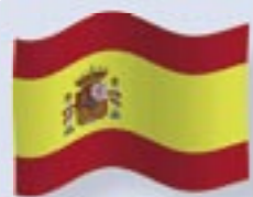
Spanien Installierte Gesamtleistung Windenergie: 10.027 MW Neuinstallationen Windenergie 2005: 1.764 MW Einwohner: 40 Millionen

► und deutsche Windenergiebranche eingekauft, um kurzfristig das notwendige Know-how zu akquirieren. Bereits heute können Kraftwerke aus den Bereichen atomarer, fossiler und erneuerbarer Energien in einem abgestimmten Verbundsystem aus einer Konzernhand bezogen werden. Auch in den deutschen Windenergie-