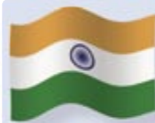
Indien Installierte Gesamtleistung Windenergie: 4.253 MW Neuinstallationen Windenergie 2005: 1.253 MW Einwohner: 1.095 Millionen

des Stroms aus Biomasse, Erdwärme, Photovoltaik, Wasser und Wind betragen rund 2,4 Milliarden Euro. Grundlage dieser Berechnung sind die externen Kosten der Stromerzeugung, zu denen die Folgen von Gesundheits-, Umwelt-, Klima- und Bergbauschäden gehören. Die Forscher kommen zu dem Ergebnis, dass diese nicht in den Strompreisen enthaltenen externen Kosten der fossilen Stromerzeugung gesamtwirtschaftlich eine erhebliche Bedeutung haben. Im Mittelpunkt stehen dabei durch Luftschadstoffe verursachte Gesundheits- und Materialschäden, landwirtschaftliche Ertragsverluste sowie Auswirkungen durch Klimaschäden.