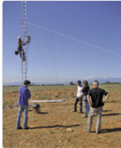
Aufbau eines Windmessmastes in den Pyrénées-Orientales