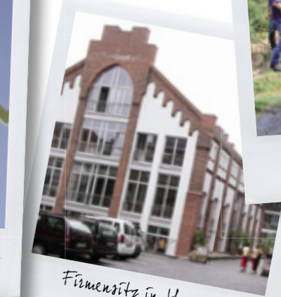
Firmensitz in Hannover im Akerbergviertel