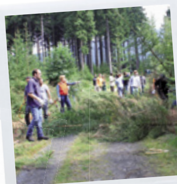
Engagement im Nationalpark Hartz 2008