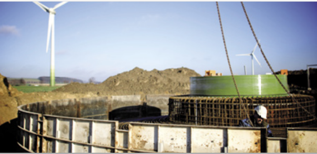
Fundamentbau im Windenergieprojekt Gehrden II / Foto: Mark Mühlhaus

Aktuelles zum Windwärts Genussrecht 2008/2009