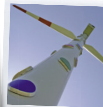
Projekt Kunst und Windenergie zur Weltausstellung 2000